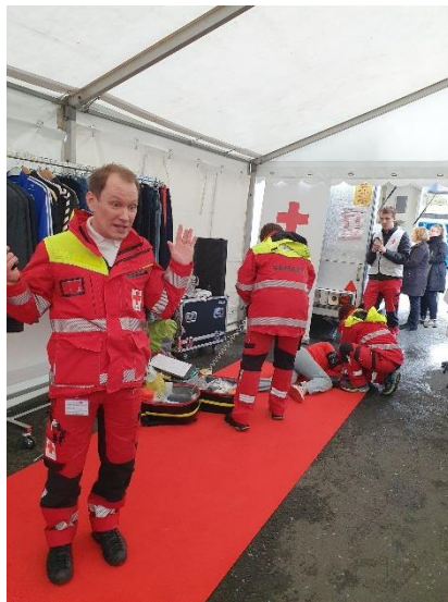
Opin venjing hjá samarittunum