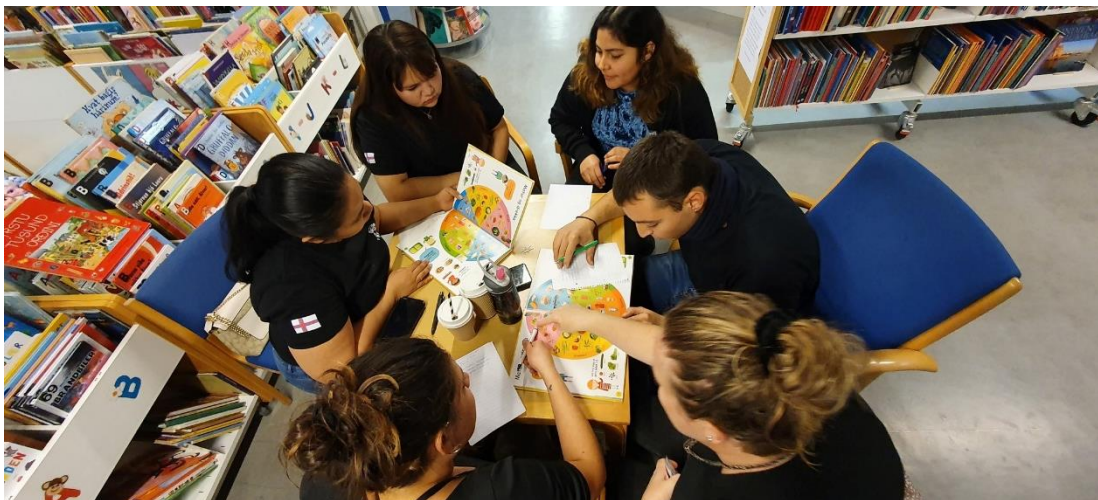
Málkafé er á Býarbókasavninum í Tórshavn og í Klaksvík

Málkaféir eru fóst tíðspunkt á bókasavninum í Tórshavn og í Klaksvík. Í Tórshavn er Málkafé hvønn hósdag kl. 17–19 á triðju hædd á Býarbókasavninum, og í Klaksvík er Málkafé tann síðsta hósdagin í hvørjum mánaði kl. 17–19 á Klaksvíkar bókasavni.