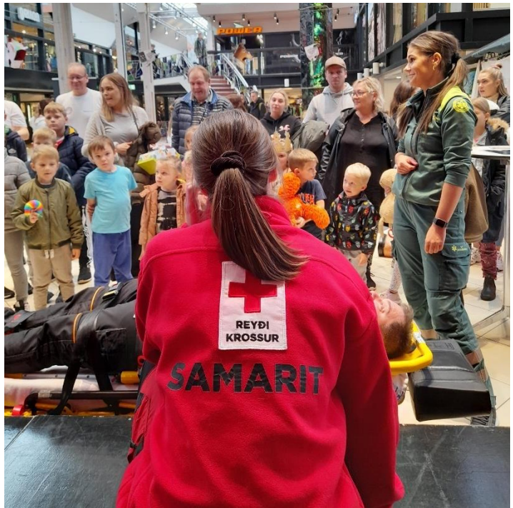
Samarittar vóru við til tiltakið Hjartastart í SMS

Betri er høvuðsstuðul hjá samarittunum. Stuðulin frá Betri ger sera stóran mun, og er eitt nú við til at styrkja karmar og umstøður hjá samarittunum, og skal harumframt síggjast sum eitt stórt herðaklapp til tað risa arbeiðið, sum samarittarnir gera fyri at økja um tryggleikan kring alt landið.