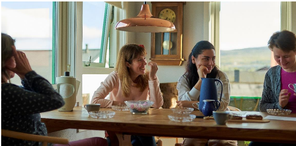
Reyða Kross Vinir

Frameftir verður millum annað arbeitt við at menna sosial tiltøk til sjálvboðin og luttakarar, og møguliga við at gera eina kanning um, hvussu tilboðið virkar.