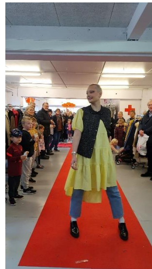
Mótaframsýning í handlinum

Endamálið við tiltakinum var at vekja áhuga fyri arbeiðinum hjá RKF, at fáa fleiri sjálvboðin og at savna pening inn til hjálpararbeiði. Tiltakið var ómetaliga væleydnað. Sera nógv fólk lögdu leiðina framvið og fingi vitan um RKF, samstundis sum fleiri nýttu høvið at lata stuðul og at gerast limir.