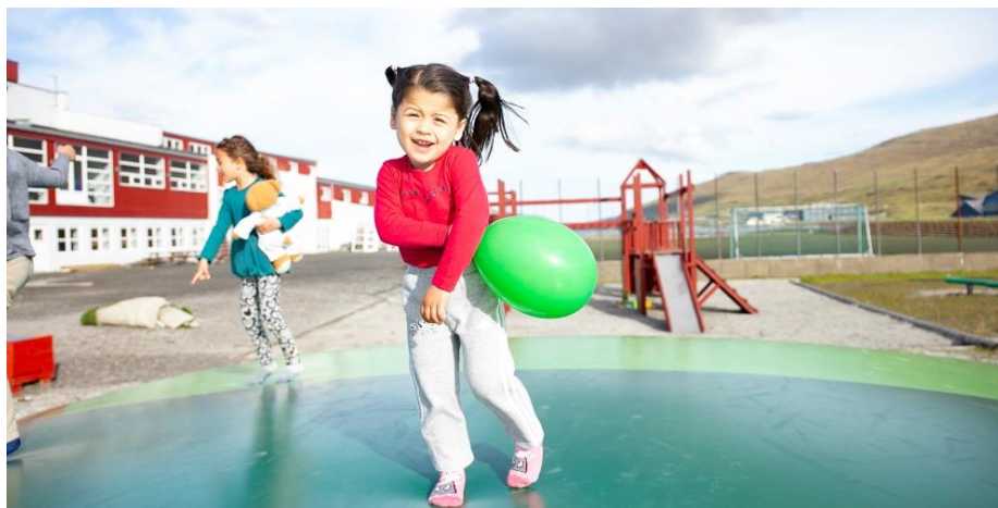
Familjulega fyri fólk við tilflytarabakgrund

Seinnu árinu eru alsamt fleiri tilflytarar komnir til Føroya. Eitt av endamállum hjá Reyði Krossi Føroya er at virka fyri at fremja vinalag og altjóða fatan millum fólk tvørturum landamørk. Tí hevur RKF síðani 2016 arbeitt við integratiúnsátøkum. Í 2022 vóru trý átøk fyri at betra um trivnað og integratiún hjá nýggju borgarunum: Familjulegan, Málkafé og Reyða Kross Vinir.