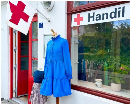
Endurnýtsluhandilin á Bryggjubakka