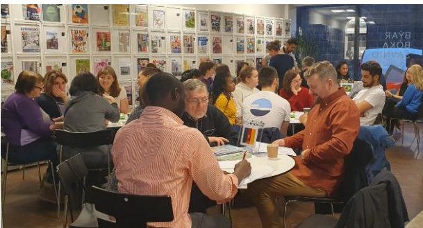
Málkafé á Fjølmentanarvikuni 2023

Tá Fjølmentanarvikan var í oktober, skipaðu Málkaféirnar fyri serligum tiltøkum. Á Málkafé í Klaksvík varð feroyskt vant við at spæla borðspøl og kvøða. Á Málkafé í Tórshavn gjørdur tey tað øvugt - vitjandi, ið vanligi koma at venja feroyskt, kundu hesuferð læra frá sær sítt móðurmál.