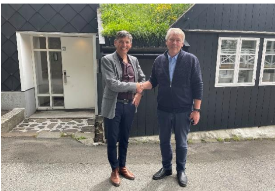
Stuðulsavtala við LÍV um Vitjanartænastruna undirskrivað

Í juli 2023 skrivaðu LÍV og RKF undir eina trý ára avtalu, sum inniber, at LÍV er høvuðsstuðul hjá Vitjanartænastruni. Tænastran hevur seinastu árin verið merkt av øktum áhuga, og tí er tað sera gleðiligt, at hendan avtalan kann vera við til at tryggja karmarnar og grundarlagið undir tænastruni.