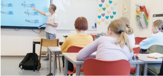
Jólagávan frá Betri: fyrstuhjálparskeið til allar næmingar í 7. flokki kring Føroyar

Nøkur skeið í sálarligu fyrstuhjálp hava verið fyri sjálvbodnum í Reyða Krossi í 2023. Hesi hava verið sera væl dámd, og verða væntandi enn fleiri hildin í 2024.