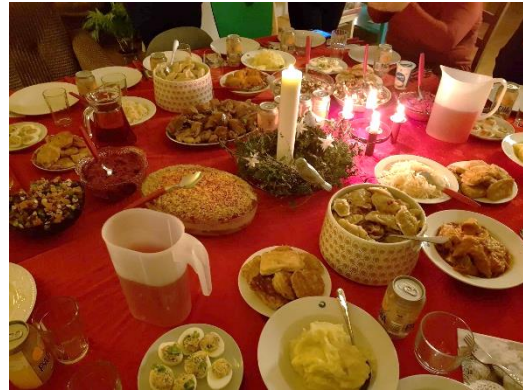
Frá jóllaborðhaldinum í Flóttamóttøkuhúsinum

Við árslok 2023 var markið á 200, sum politiska skipanin hevur sett fyri talið á flóttafólki, sum Føroyar skulu taka ímóti, næstan nátt. Politiska skipanin viðger í 2024 uppskot um at broyta hámarkið til 250.