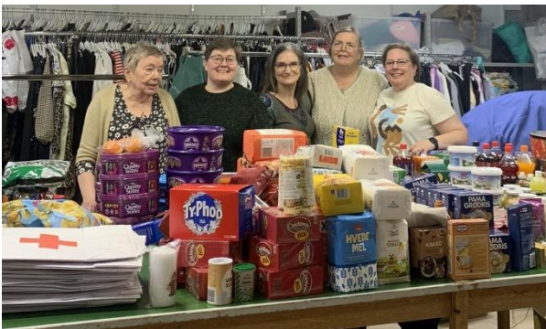
Nakað av vøruni, sum kom frá jólavognunum í FK. "Hetta er við til at bjarga jólnum" søgdu fleiri, ið komu eftir paknum.

Metstóri eftirspurningurin eftir tænanastuni í 2023 hevur havt við sær, at kostnaðurin av tænanastuni er vorðin hægri. Við góðum stuðulsavtalum vóru 303.000 kr. brúktar til at keypa mat og klæðir til tænanastuna í 2023 – í mun til 293.000 kr. í 2022.