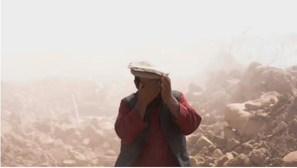
Jarðskjálvtin í Afghanistan, ið málti 6,3 stig, legði heilar bygdir í oyði, og nógv vórðu fangað undir leivdunum.

hátt ávirkað av støðuni. Lokalu Reyða Hálmánaðfeløgini stríddust fyri at bjarga fólki úr húsaleivdum og at veita neyðhjálp so sum vatn, mat, teppir og sálarligan stuðul til tey, ið høvdu mist bæði hús og familju.