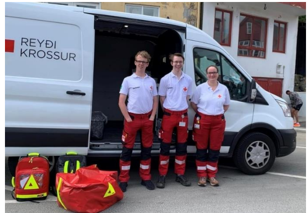
Samarittar til Tórshavn marathon, juni 2023.

Betri er høvuðsstuðul hjá samarittunum. Stuðulin frá Betri ger sera stóran mun, og er eitt nú við til at styrkja karmar og umstøður hjá samarittunum, og skal harumframt síggjast sum eitt stórt herðaklapp til tað risa arbeiðið, sum samarittarnir gera fyri at økja um tryggleikan kring alt landið.