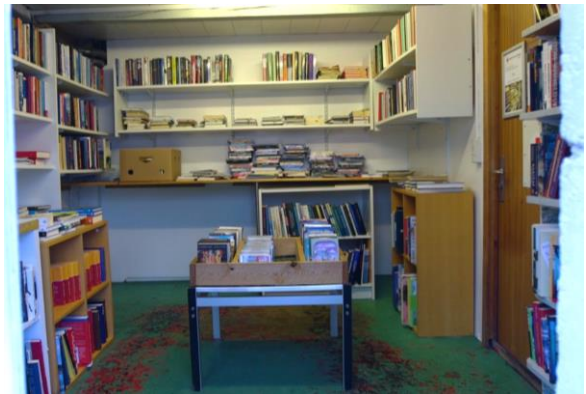
Bókasølan í Vágsbotni er ómannað tað mesta av tíðini, og er opin sjev dagar um vikuna.

Bókasølan fær allar bøkurnar ókeypis, og útreiðslurnar eru nærum ongar, og tí munar Bókasølan ógvuliga væl.